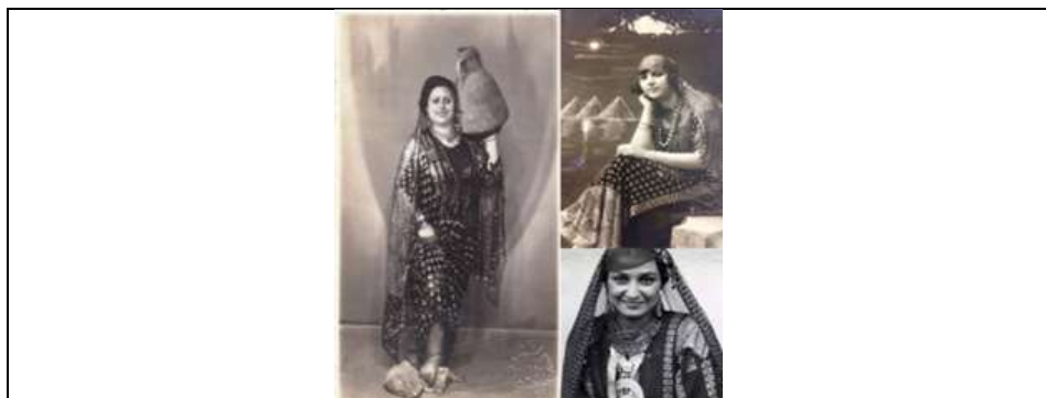
صورة رقم (30) مجموعة من النساء يرتدون الطرحة مصنوعة من أقمشة التلى

https://www.pinterest.com/pin/3307399719435731