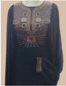
صورة رقم (8)

الخامة واللون: استخدمت خامة الستان طبقا لاتجاهات الموضة لربيع - صيف 2024 والذي يمتاز بلمعة جذابة وهو المطلوب ليتناسب مع ملابس المناسبات المرأة المصرية التي صمم من أجله التصميم ونفذ باللون الأسود لأنه وجد مهيمننا على مدارج العارضين و بما