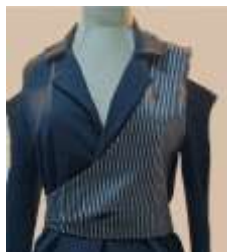
صورة رقم (29)