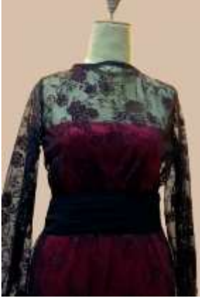
صورة رقم (16)

التصميم ينقسم إلى قطعتين يرتدوا فوق بعض، القطعة الأولى السفلية عبارة عن فستان عصري حديث بدون أكمام يبدأ من منطقة الصدر ويصل طوله إلى الكاحل وبدون اتساعات (Straight) كما توجد له فتحة في الذيل الخلفى كبيره لسهولة التحرك وتم تنفيذه باللون الأحمر الزاهى والمستمد من نفس فكرة القطعة الثانية لمصدر الاقتباس، والقطعة الثانية العلوية عبارة عن فستان له أكمام وأساور من التل الأسود المطبوع بوحدة نباتية عصرية لامعة بالبرونز الأحمر ليتناسب مع ملابس المناسبات للمرأة المصرية كما يوجد به كسرات من الشيفون الأسود عند منطقة الوسط وتم تكرارها في أساور الكم والذيل الخلفى أكبر من الذيل الأمامى كما هو مبين في مصدر الإقتباس.