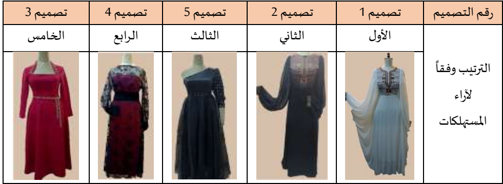
جدول (12) أفضل أول خمس تصميمات من متوسط درجات التصاميم وفقاً لآراء المستهلكات