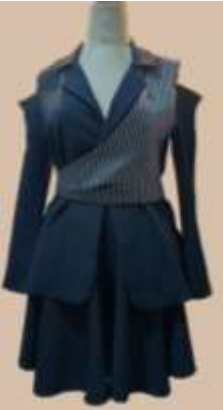
صورة رقم (28)