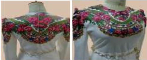
صورة رقم (26)

الخامة واللون: استخدمت خامة الستان طبقا لاتجاهات الموضة لربيع-صيف 2024 الذي يمتاز بلمعة جذابة وهو المطلوب ليتناسب مع ملابس المناسبات المرأة المصرية والتي صمم من أجله التصميم ونفذ باللون الأبيض طبقا لاتجاهات موضة ألوان ربيع - صيف 2024 وزين التصميم بزخارف أقمشة الشالكي الشعبية الأصيلة التي تمتاز بزخارف الزهور ذات الألوان المبهجة وتحمل روح التراث الشعبي المصري وجاءت تتوافق مع توقعات وتنبؤات موضة ربيع- صيف 2024 حيث يتحول المصممون إلى جمال الطبيعة مع أنماط الأزهار والمطبوعات النباتية المختلفة.