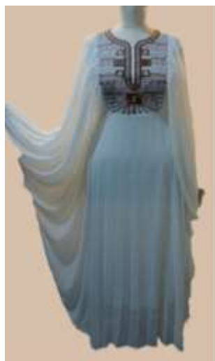
صورة رقم (3)