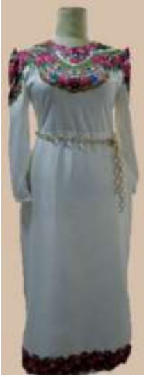
صورة رقم (25) توضيح التصميم السابع