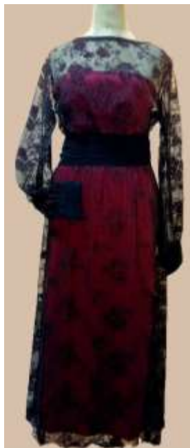
صورة رقم (15)

الجرجار: من الأزياء التراثية الأصيلة في منطقة الفاديجات وتقع في المنطقة الجنوبية من النوبة وهو عبارة عن ثوب شفاف من القطن الأسود الخفيف أو الكريشة السوداء ليس به أى زخارف وترتدى المرأة أسفل الثوب ثوب آخر بألوان صارخة، والجرجار عبارة عن لباس كامل بسفرة وكورنيش في الذيل يبدأ من الرقبة والأكتاف وحتى القدمين وأكمام تصل لرسغ اليدين وبه كسرات عند منطقة البطن ويمتاز الجرجار بأنة طويل من الذيل الخلفى عن الأمامى بحوالى من متر إلى متر ونصف وترتدية أيضا العروس ومن أسفلة الوان مبهجة.