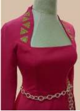
صورة رقم (12)

التصميم لفستان عصرى بقصة برنسييس بأكمام طويلة ويصل طول الفستان لمنتصف الساقين، وفتحة الرقبة مفتوحة على شكل مثلث بمساحة كبيره بما يتماشى مع مصدر الاقتباس ومزخرف بأسلوب الأبليلك المصنوع من اللدائن ذات الألوان الذهبية اللامعة والتي تأخذ تلك الأباليلك الشكل الزخرفي النوبي (وحدة المثلث)، وتم تثبيت المثلثات بطريقه متتالية ومعكوسه بحيث مثلث يكون إتجاهه لأعلى وآخر لأسفل، واستخدم حزام على شكل حلقات دائرية متصلة ببعضها البعض، وهو مقتبس من الدائرة التى ترمز للشمس .