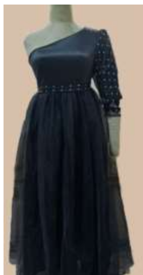
صورة رقم (19)

توصيف مصدر الإقتباس: أقمشة التلى هي منسوجات من الشبيكة (التل) ولفظ تلى يطلق