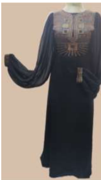
صورة رقم (7)

يعتبر من أزياء المناسبات لواحة سيوة للعروس زي يوم الحنة بالواحة يسمى (أكبرن تدللت) ويمتاز بلونة الأسود وبرقبة مستديرة يشق أسفلها بفتحة واسعة تشبه مفتاح الحياة تصل الى منتصف وسط الثوب وتتركز الزخارف حول فتحة الرقبة وعلى الصدر بخطوط أفقية وإشعاعية ومنكسرة امتدت بكل نواحي الثوب على هيئة صفوف تأخذ شكل أشعة الشمس وهذه الصفوف عبارة عن تطريز بألوان مختلفة كالأحمر والأصفر والأخضر والبرتقالي وتستخدم على أبعاد معينة أزرار تسمي تحجبت وهي أزرار مصنوعة من الصدف ويتشعب من الطوق المطرز حول الرقبة.