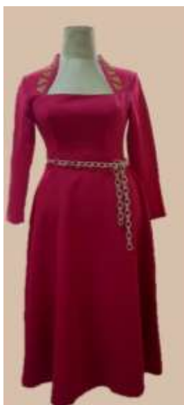
صورة رقم (11) توضح التصميم الثالث

استمد الفنان النوبى وحداتة الزخرفية ودلالاتها الرمزية التى تهدف لجلب الخير أو دفع الشر، فالمجتمع النوبى مجتمع مغلق تحكمه العادات والتقاليد المتوارثة، كما توارثت فيه الزخارف ومدلولاتها التى تمحورت حول الخوف من الحسد ومحاولة إتقاء شره، ومن الزخارف الهندسية المهمة: وحدة المثلث والتى من النادر أن نجد عملاً زخرفياً دون أن يحتوى فى أجزائه على تشكيلات من هذه الوحدة فنجده فى الملابس والمنازل وتعد وحدة المثلث رمز الروح حيث صنعت الأحجبة على شكل مثلث للحماية من الحسد والروح الشريرة، كما يرمز للسمو والعلو، فباتجاه المثلثات لأعلى ولأسفل يدل على الاتصال بين السماء والأرض، وتكرارها بجانب بعض يعنى التسبيح الدائم، ومن الزخارف الهندسية الدائرة فهى ترمز للعبادات القديمة، وكذلك ترمز للشمس والضوء.