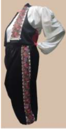
صورة رقم (22) توضيح التصميم الخامس