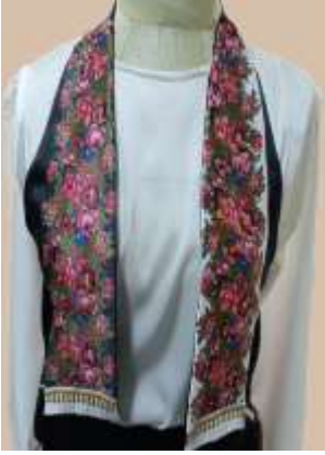
صورة رقم (23)

توضيح الجزء المطبوع بالوحدات الزخرفية التراثية بالتصميم السادس