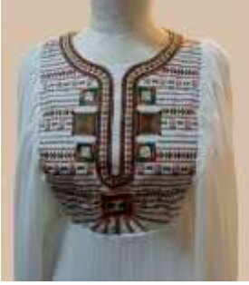
صورة رقم (4)

التصميم عبارة عن عباءة طويلة محبكة من أعلى من منطقة الصدر وحتى خط الوسط ، ومن خط الوسط تكون متسعة حتي خط الذيل واستخدمت كسرات البليسية للجزء السفلي للتصميم ليترباط مع الخطوط الإشعاعية في التصميم الزخرفي من أعلى ويتمركز التصميم الزخرفي بمنطقة الصدر وهي عبارة عن وحدات زخرفية مقتبسة من بعض الوحدات الزخرفية لواحة سيوة وموزعة بنفس طريقة توزيع الزي الخاص بالعروس بالواحة (ناشراح داخواق) (صورة رقم 3)