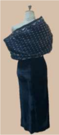
صورة رقم (32) توظيف خامة التلي في التصميم التاسع

الخامة واللون: استخدمت خامة القטיפه والذي يمتاز بلمعة جذابة ليلائم ملابس المناسبات للمرأة المصرية والتي صمم من أجله التصميم ونفذ باللون الأسود لأنه وجد مهيمننا على مدارج العارضين طبقا الاتجاهات موضحة ربيع، وصيف 2024، وخامة التل المطرزة برقائيق الفضة مما يعطى مظهر جذاب ذات لامعة.