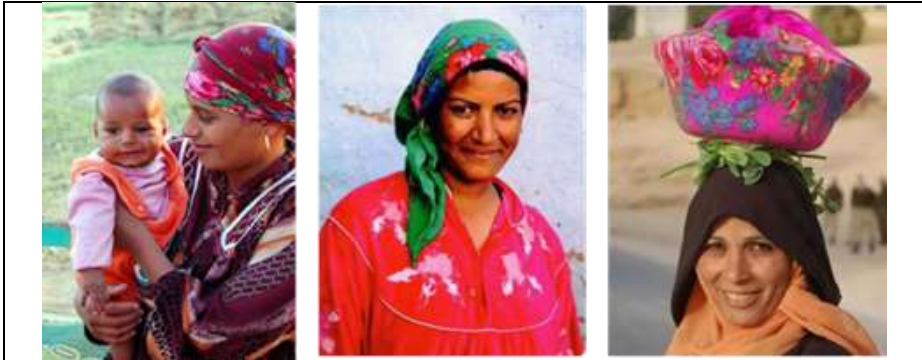
صورة رقم (24) مجموعة من النساء يرتدون الإيشارب من خامة الشالكي بطرق متنوعة

مصدر الاقتباس: الإيشارب من أقمشة الشالكي:-