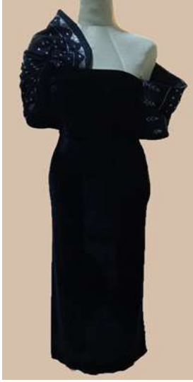
صورة رقم (31) التصميم التاسع